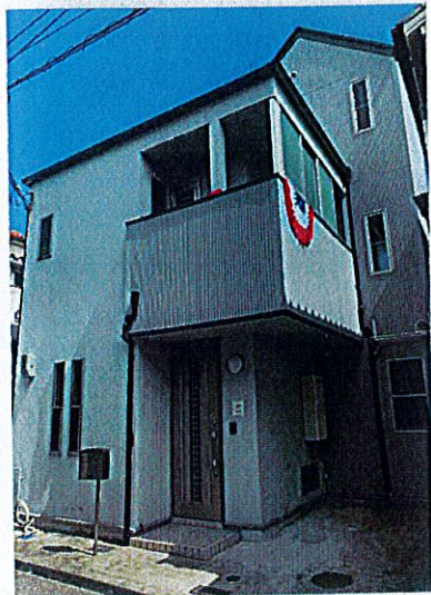
駐車スペース1台分♪