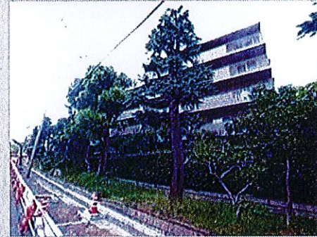
完成予想CG、完成写真、360°パノラマビュー など物件情報をご覧になれます！